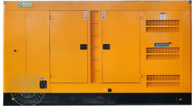
静音型机组（需选装）