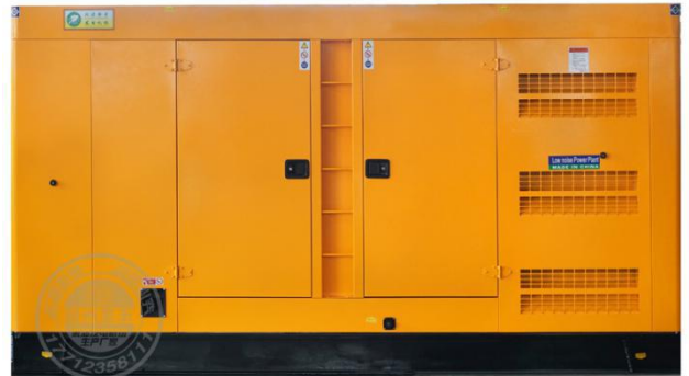
静音型机组（需选装）