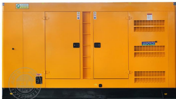
静音型机组 (需选装)